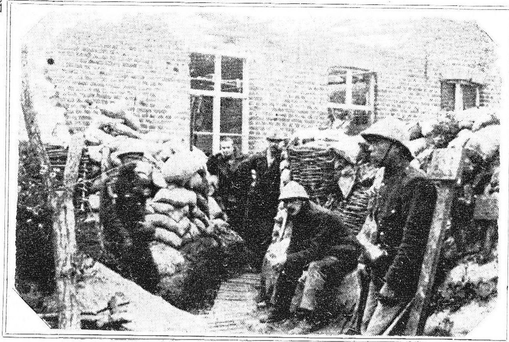
Boyau de communication vers l'Yser.